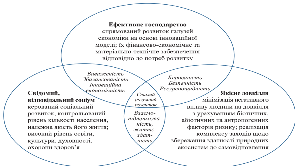
Рис. 1. Глобальна парадигма сталого «розумного розвитку» територіальних громад

Як засвідчує досвід низки розвинених європейських країн, таких, зокрема, як Німеччина, Франція, Великобританія, Норвегія, Швеція, процес утвердження такої парадигми супроводжується посиленням ролі знань та інновацій у господарському процесі на рівні громад, а також якості управління ними.