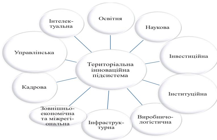
Рис. 3. Територіальні підсистеми та їх складові елементи

висунуто ініціативу трансформувати цілі ЄС у національні стратегії держав-членів. Цілі відображають основну суть «розумного» (smart), стійкого і всеосяжного зростання, у їх межах ЄС ставить перед собою велику кількість завдань у процесі реалізації об'єднуючої для ЄС стратегії «Європа – 2020». Пріоритетними визначені такі 7 напрямів діяльності: створення можливостей для збільшення фінансування досліджень та інновацій («Інноваційний Союз»), підвищення результативності освітніх систем і сприяння залученню молодих людей на ринок праці («Рух Молоді»); забезпечення повсюдного доступу до високошвидкісного інтернету і доступності загального цифрового комерційного простору для фізичних та юридичних осіб («План розвитку цифрових технологій в Європі»); забезпечення екологічності виробництва («Доцільне використання ресурсів у Європі»); поліпшення підприємницького середовища та підтримка розвитку потужної і стійкої промислової бази для повсюдної глобалізації («Індустріальна політика, спрямована на глобалізацію»); модернізація ринків праці та сприяння трудовій мобільності («План з розвитку нових здібностей і збільшення кількості робочих місць»); зниження рівня бідності за рахунок соціальної і територіальної взаємодії («Європейська політика проти бідності»). Сім вищезазначених напрямів пріоритетного управлінського впливу визначили характерні особливості європейської парадигми здійснення державного управління сталим розвитком територій.