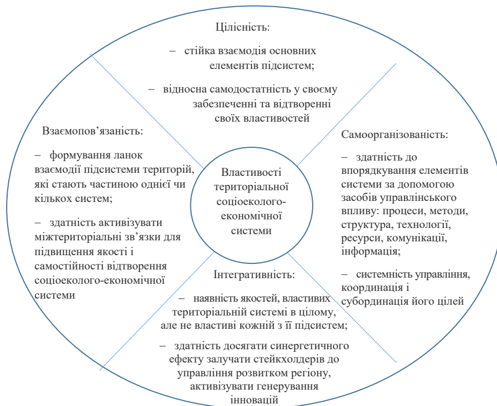
Рис. 2. Властивості «розумної» соціо-еколого-економічної системи територіальної громади

Істотна особливість місцевого господарства полягає в його базовому положенні щодо системи територіального управління (Єрохіна, 2015), яке визначає його ключові властивості, що впливають на формування інноваційного потенціалу (рис. 2).